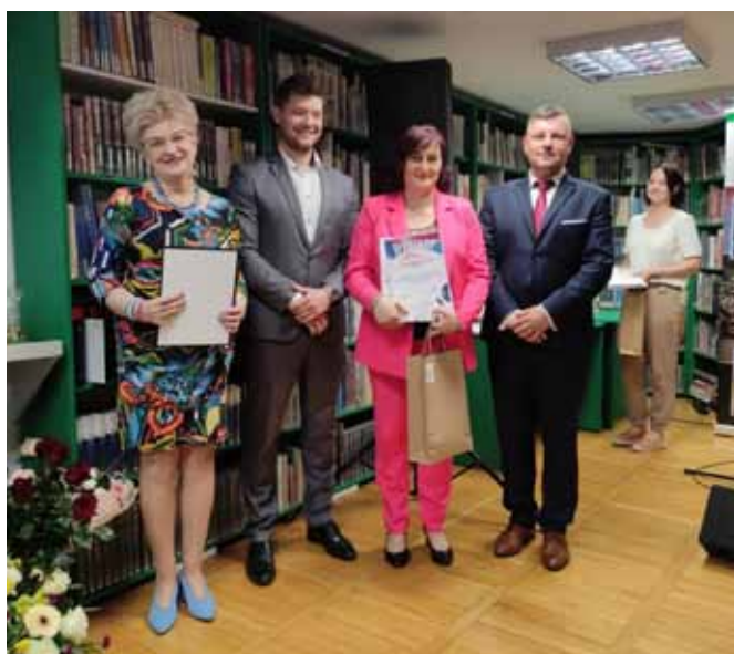
Wyróżnienie dla GBP w Bestwinie