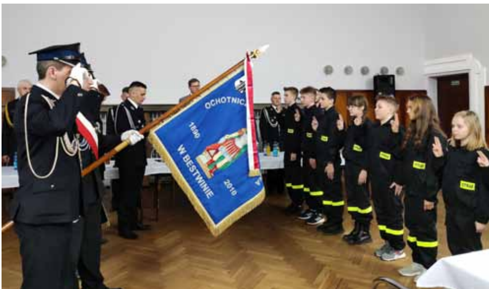
Przyrzeczenie Młodzieżowej Drużyny Pożarniczej