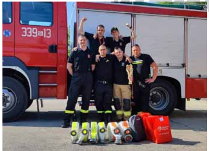
Drużyna ratowników OSP Bestwina