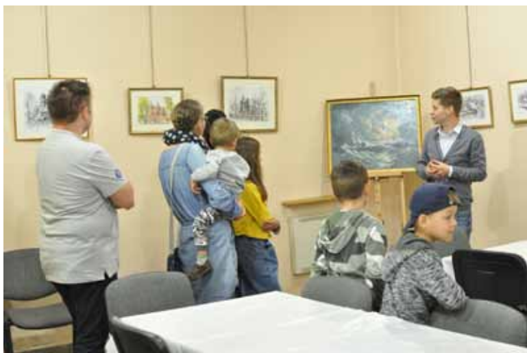
Zwiedzanie wystawy obrazów Pawła Kiermasza