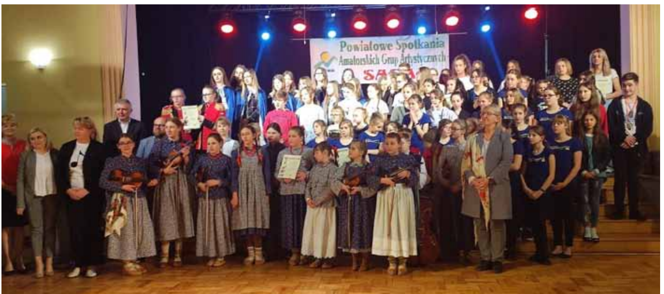
Laureaci przeglądu „Saga” w Kozach