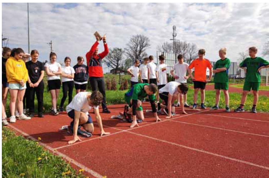
Na miejsca – gotowi – start!

Chłopcy: 1 – Bestwinka, 2 – Bestwina, 3 – Kaniów.