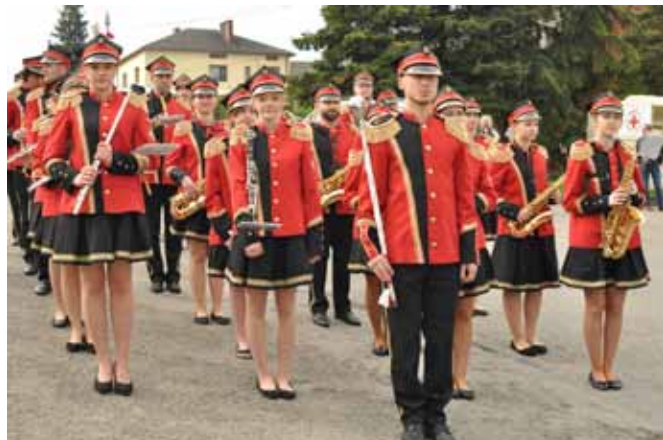
Uroczystość uświetniła Orkiestra Dęta Gminy Bestwina z siedzibą w Kaniowie