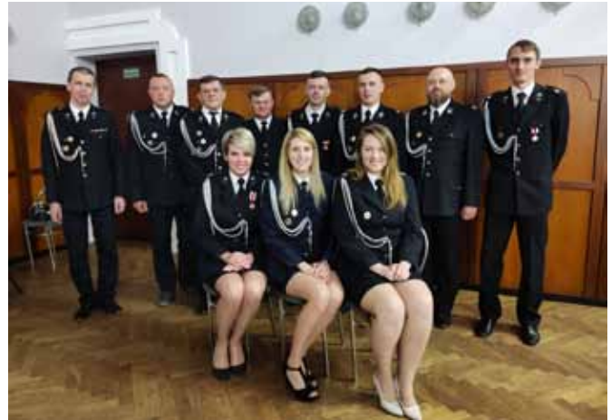
Zarząd OSP Bestwina

130 członków, w tym 84 zwyczajnych, 3 honorowych i 43 wspierających – tak przedstawia się w Bestwinie stan osobowy. Nie można zapomnieć o 30 druhnach i 10 członkach i członkiniach MDP. Najmłodszy w obecności sztandaru złożyli podczas zebrania swoje przyrzeczenie. W przyszłości to oni zastąpią starszych i będą uczestniczyć w akcjach ratowniczo – gaśniczych. Skoro mowa o wyjazdach – w roku 2021 wyjeżdżano do 57 zdarzeń, w tym do 16 pożarów i do 39 zagrożeń miejscowych. Dwa alarmy okazały się fałszywe. Aby skutecznie walczyć z żywiołami i ratować życie, zdrowie i mienie, przepro-