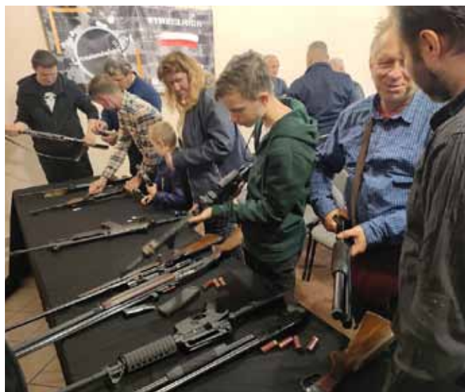
Chętni zapoznali się z różnymi typami broni palnej

Wszystkich zainteresowanych odsyłamy na strony organizatorów wydarzenia: http://stowarzyszeniesparrow.pl/ oraz https://aks.strzelambolubie.eu/